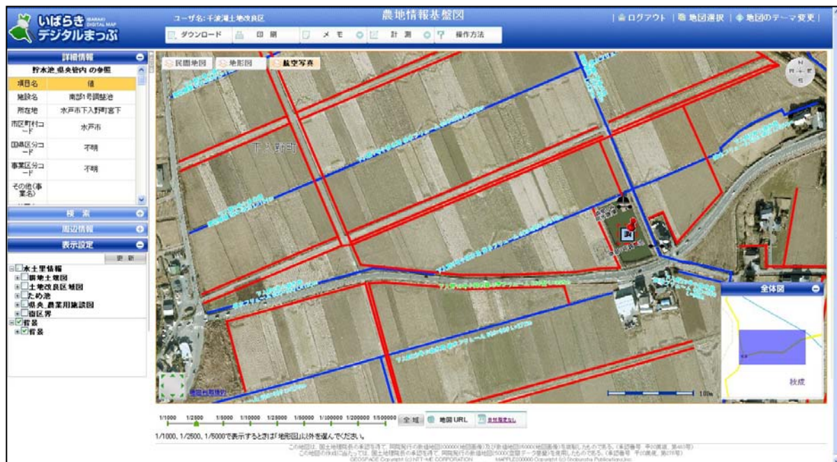
デジタルオルソ画像の上に農業用排水施設図を表示