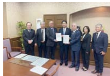
進藤財務大臣政務官へ 要望書手渡し