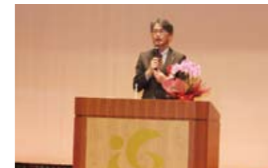
祝辞 岡田農政水産部長