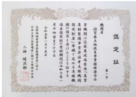
「発注者支援機関」の 認定を受けています

本会においても、令和5年1月15日に「発注者支援機関」の認定を受け、防災、減災対策や農業基盤の整備等を円滑に行うため、会員である市町、土地改良区等から委託を受け、土地改良事業の工事(工事施工のために必要な調査・計画・設計・積算、施工管理等)に取り組んでいます。積極的な活用をお願いします。