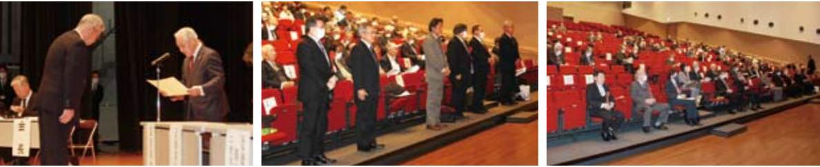
土地改良事業功労者表彰式