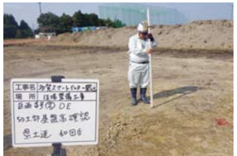
簡易ほ場整備工事 基盤標高確認